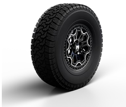
ОПЦИЯ: ВНЕДОРОЖНЫЕ ДИСКИ «OFFROAD» ШИНЫ R20 295/60 (AT Tire) 10 650 BYN