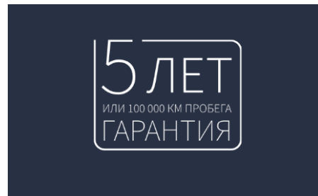
Пакет «5-летняя гарантия»