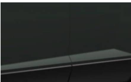
Эксклюзивный тёмно-зелёный цвет