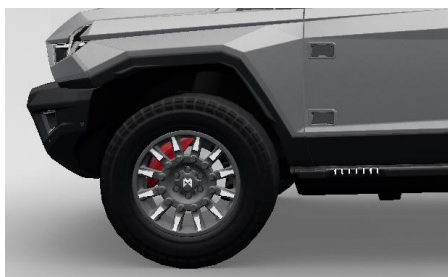
Суппорты красного цвета