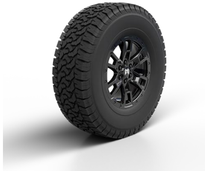
ОПЦИЯ: ЛЕГКОСПЛАВНЫЕ ДИСКИ «SCORPION» ШИНЫ R20 275/65 (AT Tire) 2 250 BYN