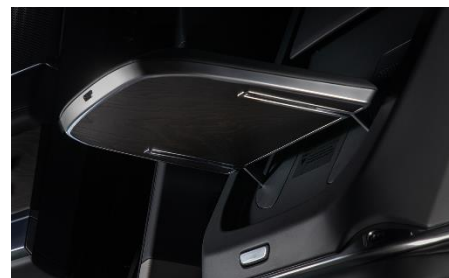
Столики в спинках сидений из массива дерева