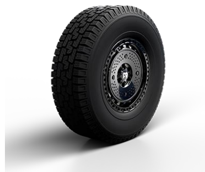
ОПЦИЯ: КОВАННЫЕ ДИСКИ «SCORPION» ШИНЫ R20 275/65 (AT Tire) 8 200 BYN