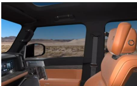
Отделка потолка тёмной алькантара Dinamica®