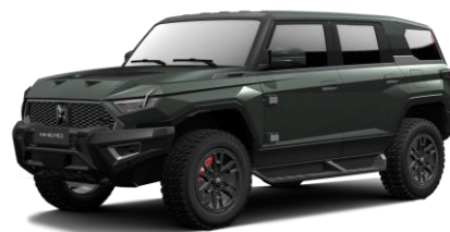
Эксклюзивный темно-зеленый (+3 000 BYN)