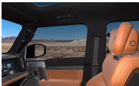
Отделка потолка темной алькантара Dinamica 4 950 BYN