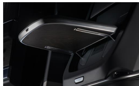
Столики в спинках сидений из массива дерева 1 490 BYN