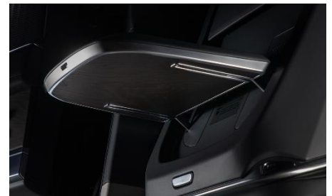
Столики в спинках сидений из массива дерева 1 490 BYN