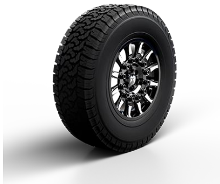
Легкосплавные диски DESIGN 3 шины R20 295/60 All Terrain 10 650 BYN