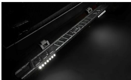
Выдвижные боковые подножки с электроприводом 6 690 BYN