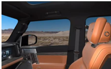
Отделка потолка темной алькантара Dinamica 4 950 BYN