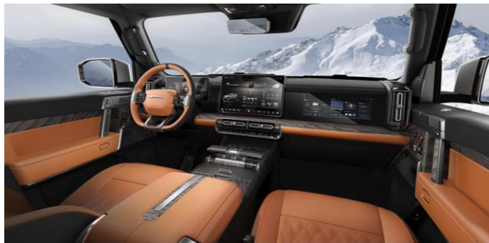
Коричневый с черными элементами