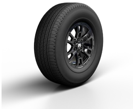
Легкосплавные диски DESIGN 1 шины R20 275/65 Highway Terrain Стандарт