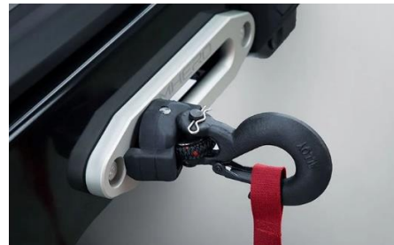
Пакет Off-road: электрическая лебедка 3 800 BYN

При заказе опций в пакете Style: Выдвижные боковые подножки с электроприводом / Отделка потолка темной алькантара Dinamica / Столики в спинках сидений из массива дерева – действует специальная цена 8 250 BYN.