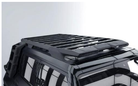
Пакет High Roof: багажник на крыше 10 600 BYN