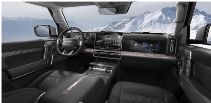
Черный с серыми элементами